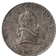
Pièce d'argent dite : « franc blanc »

Cette monnaie a été remplacée sous Charles VI (1380-1422) par l'écu d'or à la couronne. Après la reprise de la guerre de Cent Ans, les désordres monétaires se sont aggravés, notamment après la défaite d'Azincourt en 1415. La reconquête du royaume, menée par Jeanne d'Arc, a permis à Charles VII (1422-1461) de restaurer son autorité politique et monétaire et, à l'occasion d'une réévaluation, le roi a fait frapper en 1423 un nouveau "franc à cheval" avec la volonté d'un retour à la bonne monnaie. Mais celui-ci ne va pas résister au retour de l'écu d'or et il va disparaître pour 150 ans. Il faut attendre 1575 pour qu'Henri III (1574-1589) crée un franc d'argent, appelé "franc blanc", avec l'ambition de faire correspondre monnaie de compte et monnaie réelle.