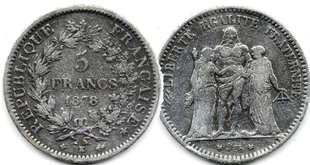
Pièce d'argent « Union latine » de 5 francs ( 25 grammes)

C'est sur cette base que s'est constituée l'Union latine en 1865 par une convention unissant la France, la Belgique, la Suisse et l'Italie, rejoints par la Grèce dès 1868. Ce traité instituait une organisation monétaire commune fondée sur le régime de bimétallisme or-argent, l'unité de compte commune étant le franc, l'Italie et la Grèce, gardant cependant le nom de leur monnaie nationale pour désigner cette même unité de compte. Cette Union va réussir à se maintenir jusqu'au 1 er janvier 1927.