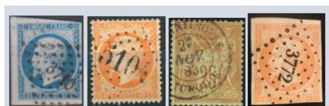
(1) losange petits chiffres 3710 (Alger, Algérie) – (2) losange grands chiffres 5104 (Shanghai, Chine) – (3) cachet à date (Constantinople, Turquie) – (4) losange petits chiffres (Rhodes, Levant).

Ces timbres de métropole ont été également utilisés dans différents bureaux de poste français implantés à l'étranger pour les besoins du commerce international. Presque chacune des escales de la dynamique compagnie française des "Messageries Maritimes" a eu son bureau de poste. On a ainsi utilisé ces timbres dans une quarantaine de bureaux français situés dans l'empire ottoman, qui s'étendait alors du nord de la Grèce jusqu'en Afrique du nord, mais aussi en Chine, au Japon et même à Bâle (Suisse). Chacun de ces