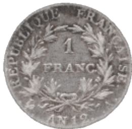
Pièce d'argent dite : « franc germinal » ( an 12)

Devant l'anarchie de la circulation monétaire où se côtoient écus, louis d'or et pièces révolutionnaires de divers métaux, le consul Bonaparte va rebâtir par les lois de germinal an VI, un système monétaire sur la base d'un franc d'argent dit "franc germinal" qui va supplanter, cette fois définitivement, l'ancien louis d'or. Malgré la mise en circulation de 500 millions en pièces d'or de 20 francs (le fameux "napoléon") et de 40 francs et de près de 900 millions en pièces d'argent de 5, 2 et 1 franc, ces quantités vont s'avérer insuffisantes et il faudra de nouveau avoir recours au papier-monnaie dont l'émission est confiée à la Banque de France (récemment créée). Cette fois ci, une réserve métallique permet d'en maintenir le cours. Dans ces conditions, le papier monnaie va prendre progressivement son essor et le franc germinal va se révéler comme une réussite, restant relativement stable malgré la valse des régimes politiques jusqu'en 1914.