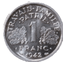
Pièce de 1 franc de l'Etat français (1942)

La stabilisation ne va pas durer 10 ans. Le franc va se trouver de nouveau malmené à la suite de la grande crise des années 1930 qui va obliger le Front populaire de dévaluer la monnaie nationale qui va perdre les 2/3 de sa valeur entre 1936 et 1940. La défaite en 1940 va lui porter un nouveau coup car l'Allemagne va imposer un taux de change exorbitant de 1 reichsmark pour 20 francs, lui permettant de piller le pays déjà soumis à des frais d'occupation quotidiens de 400 millions de francs quotidiens.