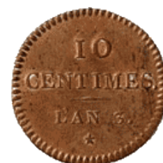
Pièce de 10 centimes (an 3)

C'est à cette même époque que le système duodécimal (basé sur la douzaine) va être abandonné au profit du système décimal (basé sur la dizaine). En 1795, la Convention va réintroduire le franc comme unité monétaire officielle de la République en remplacement du louis d'or, monnaie de l'ancien régime. Entré en fonction en 1795, le Directoire, devant le nouvel échec du papier-monnaie, va réussir à rétablir une circulation plus intense des espèces métalliques, grâce notamment à une refonte avantageuse des monnaies et à un afflux de métal venant d'Italie après la campagne de Bonaparte. Il va également abolir le cours forcé du papier-monnaie en 1797.