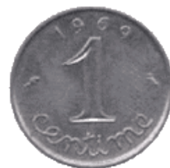
Pièce de 1 centime (1969)

Revenu au pouvoir en 1958, le général de Gaulle va décider de procéder à une nouvelle dévaluation de 17,55 % et annoncer la création d'un "franc lourd" qui sera mis en circulation en 1960 avec une valeur de 100 anciens francs.