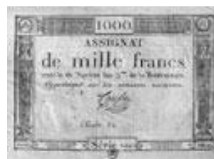
Assignat de 1 000 francs.

Dès 1783, la situation générale du royaume et l'endettement de la monarchie étaient tels que les pièces ne parvenaient plus guère au trésor royal. En 1789, la Révolution va hériter des dettes de la monarchie : environ cinq milliards de livres, auxquelles s'ajoutent des intérêts, fixés à des taux particulièrement élevés ! Devant la pénurie d'espèces, la Convention va recourir au papier, d'abord sous forme de billets d'escompte, puis d'assignats gagés sur les biens nationaux confisqués à l'église. Mais le système n'étant applicable qu'aux fortes sommes, le problème de la petite monnaie courante va rester entier. A défaut de réserves métalliques, vaisselle et objets précieux vont être réquisitionnés. Tout ce qui est métallique et en particulier les cloches des églises va être fondu mais la thésaurisation du métal est telle qu'elle va entraîner la multiplication des assignats, associée à une inflation galopante. A partir de 1793 et jusqu'à la chute de Robespierre, afin de tenter d'assainir la situation, le gouvernement va recourir à la terreur monétaire en pratiquant l'emprunt forcé et à la confiscation des métaux précieux tout en menaçant les récalcitrants de guillotine.