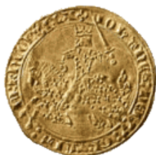
Pièce d'or dite : « franc à cheval »

Le premier franc, le "franc à cheval", a été émis en 1360. Cette pièce d'or a été frappée pendant la guerre de Cent Ans pour payer la libération du roi Jean le Bon, qui avait été capturé par les Anglais en 1356. Le terme "Franc" signifie que le roi est franc des Anglais, c'est à dire libre.