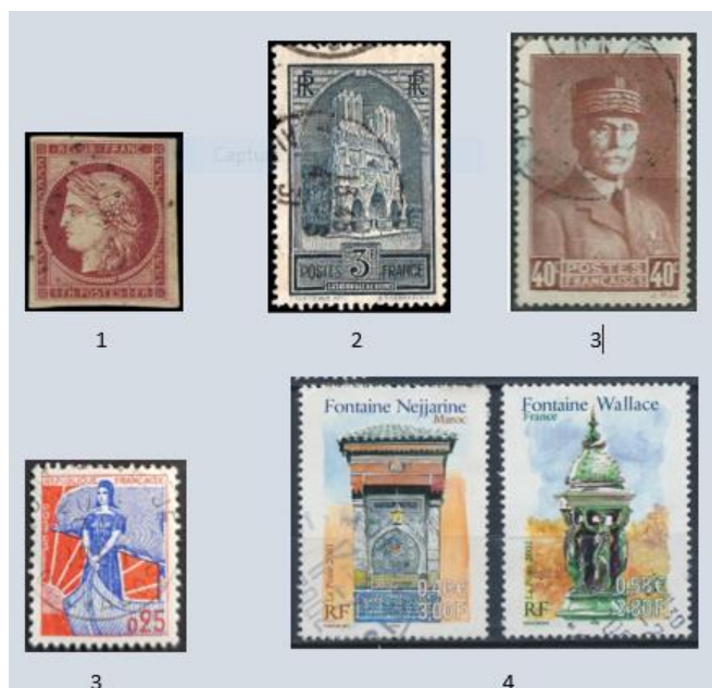
(1) le premier timbre en francs (franc germinal, 1849) – (2) période du franc Poincaré (1929) – (3) période Etat français (1940) – (4) l'un des premiers timbres en nouveaux francs (Marianne à la nef, 1960) – (4) les derniers timbres en francs avec valeurs en francs et en euros (2001).

C'est donc naturellement en France qu'apparaît pour la première fois la mention du franc (appelé alors franc germinal) sur un timbre-poste le premier janvier 1849. Il s'agit du 1 franc carmin de type Cérès qui est accompagné par le 20 centimes noir. Par la suite,