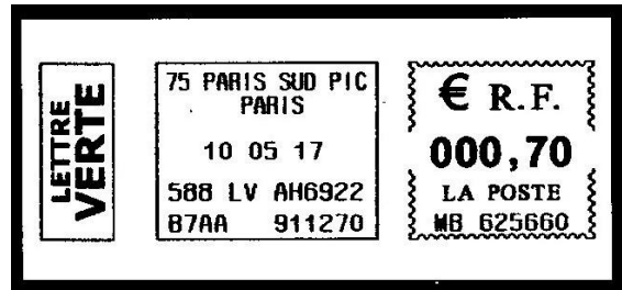
Empreinte de machine 75 Paris Sud PIC (2017)

2004 afin de remplacer les CTC. Ainsi, les cinq Centres de Traitement du Courrier du Nord de Paris ont été remplacés en 2004 par le PIC Paris-Nord situé à Gonesse, suivis en 2007 par les CTC du Sud de la capitale remplacés par le PIC Paris-Sud situé à Wissous.