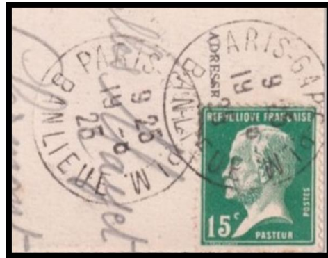
Paris Gare PLM Banlieue sur Pasteur (1925)

A ces bureaux, ont été rattachés à partir des années 1960, des centres qui n'étaient pas installés dans une gare. Ainsi, le centre de tri Paris-Brune, ouvert en 1962 relevait de la Direction des services ambulants.