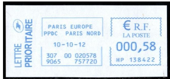
Empreinte de machine Paris Europe PPDC (2012)

Avec la diminution du volume de courrier à traiter, sur les 55 PIC existants en France en 2013, il n'en restait plus que 26 en 2020 avec pour objectif de réduire à 20 pour 2026.