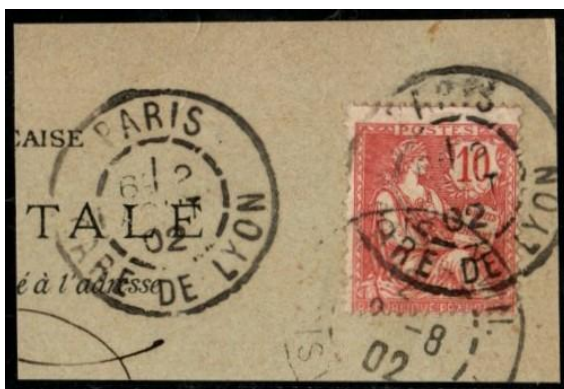
Paris Gare de Lyon sur Mouchon (1902)

A ces bureaux, ont été rattachés à partir des années 1960, des centres qui n'étaient pas installés dans une gare. Ainsi, le centre de tri Paris-Brune, ouvert en 1962 relevait de la Direction des services ambulants.