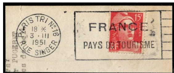
Paris Tri N°16 sur Marianne de Gandon (1951)