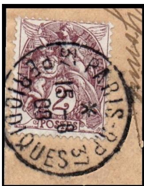
Paris RP Périodiques (1900)