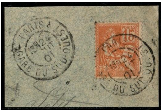
Paris Gare du Sud-Ouest sur Mouchon (1901)