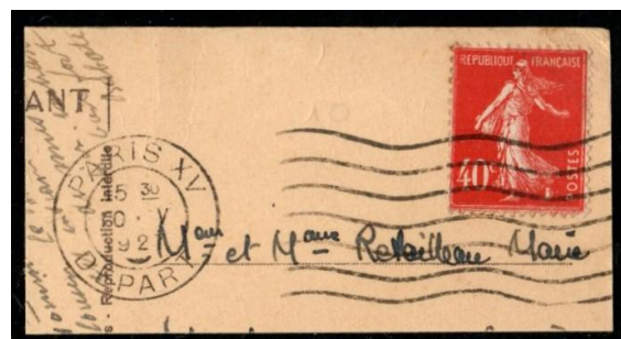
Paris XV départ sur Semeuse