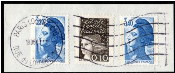
Paris Louvre CTC sur Marianne de Beaujard (2001)

L'obsolescence des locaux a entraîné la fermeture définitive de beaucoup d'autres. Une nouvelle organisation a été mise en place autour d'un réseau de 130 centres de traitement du courrier (CTC), chaque département étant pourvu au minimum d'un centre.