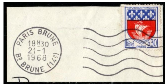
Paris Brune sur Blason de Paris (1968)

Afin de décongestionner les services de tri de la Recette principale de Paris, le courrier « banlieue » a été confié aux bureaux-gare bien avant 1900 et 8 bureaux sont devenus centralisateurs du trafic partant ou arrivant de la banlieue parisienne