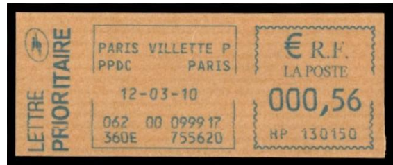
Empreinte de machine Paris Villette PPDC (2010)

Les locaux de ces CTC sont occupés maintenant par les nouvelles Plateformes de Préparation et de Distribution du Courrier.