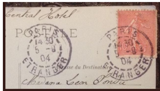
Paris Etranger (1904)