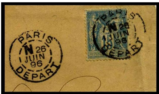
Oblitération Paris Départ sur Sage (1896)

Ce bureau spécial a gardé le monopole de la centralisation et de la distribution du courrier pour l'ensemble de la capitale jusqu'en 1901, tâche transférée par la suite aux bureaux d'arrondissements, au fur et à mesure de leur création.