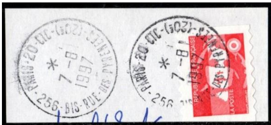
Paris 20 CTC sur Marianne de Briat (1997)

Dans le cadre du plan Cap Qualité Courrier, les plateformes Industrielles du Courrier (PIC) ont été créés à partir de