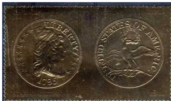
Un des timbres de Staffa objet du litige.

tarif douanier. S'ensuit un long débat avec l'imprimeur Calhoun's Collectors Society, Inc. qui soutient de son côté qu'étant donné qu'il s'agit de timbres-poste, ce sont des articles imprimés sur lesquels aucun droit n'est exigible.