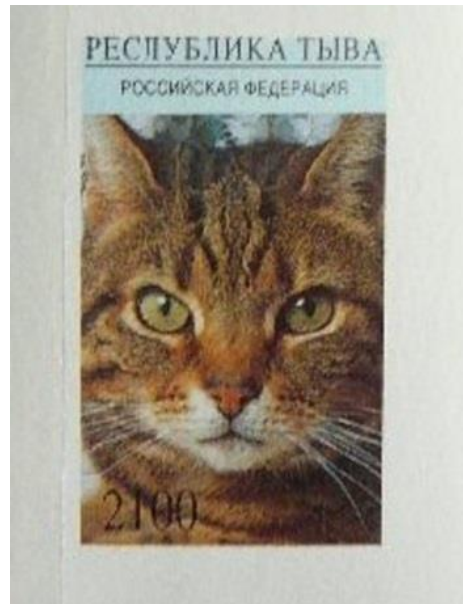
Timbre non dentelé du Touva