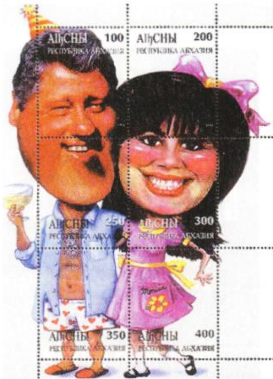
Feuillet d'Abkhasie Clinton et Levisky

Pire, un autre bloc de Batoum montre un chien qui vomit, le vomi s'écoulant en belles couleurs sur deux timbres du bloc... effet garanti ! Une série récente de Birodidjan montre des images extraites du Kamasutra : des coupes en train de copuler, leurs organes génitaux bien en évidence. Feigenbaum n'a décidément pas de limites puisqu'il trouve des acheteurs !