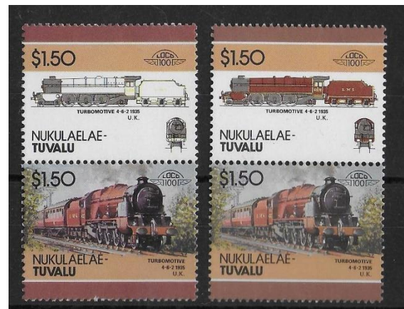
Timbre du haut à gauche avec couleur omise

continuant à faire imprimer des timbres. Le procureur général de Tuvalu qui n'a pas goûté la plaisanterie engage aussitôt une procédure pour outrage au tribunal et Feigenbaum est condamné à trois mois de prison et une amende de 3000£, décision qu'il porte en appel, ce qui lui permet, dans l'attente, d'échapper à la prison moyennant une caution. En appel l'amende de 3 000 £ a été confirmée, mais la peine de prison et les frais de justice d'environ 100 000 £ ont été annulés. Feigenbaum ne perd cette année-là que Format International Security Printers qui fait faillite.