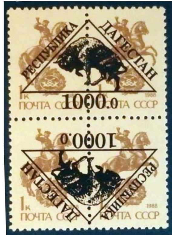
Bloc de 4 du Daghestan avec surcharge droite et inversée.

Par ailleurs, André Dufresne pense que c'est Feigenbaum qui a acheté par millions les timbres petit format d'usage courant de l'ex-Union Soviétique dont la valeur nominale était devenue inutile en raison des effets dévastateurs de l'inflation et qui les a ensuite surchargés du nom de toutes sortes de territoires réels ou imaginaires et de motifs thématiques à la mode.